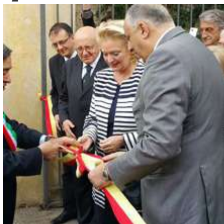
Il taglio del nastro

Dopo 225 anni è stato riaperto il cancello che separava Villa Giulia e l'Orto botanico . "Oggi - ha commentato il sindaco Leoluca Orlando - è un momento storico